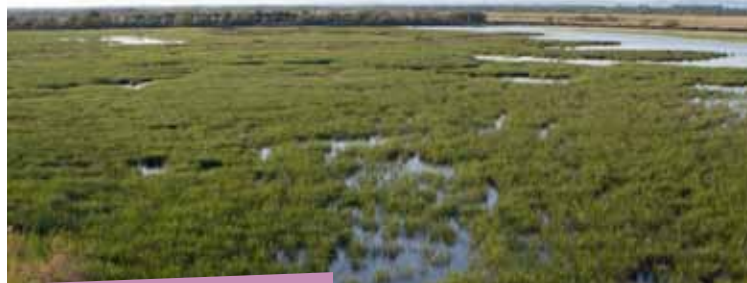
Marais du Vigueirat